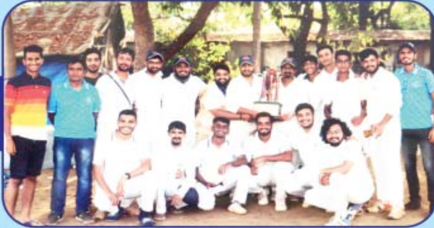
Emerging Cup Winners - Antara Aces Junior