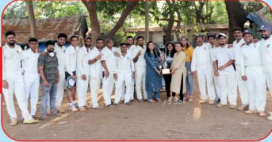
Elite Cup Winners - Yuva Shakti CC