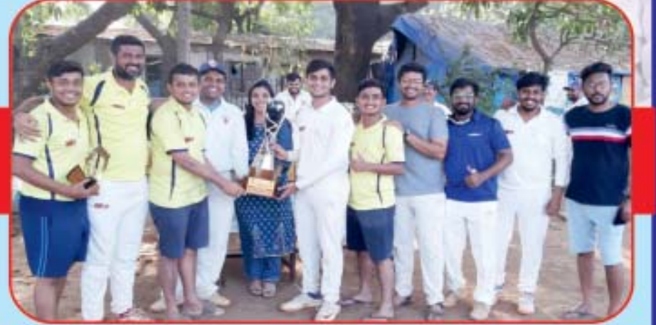
Elite Cup Runners Up - Young Mens CC