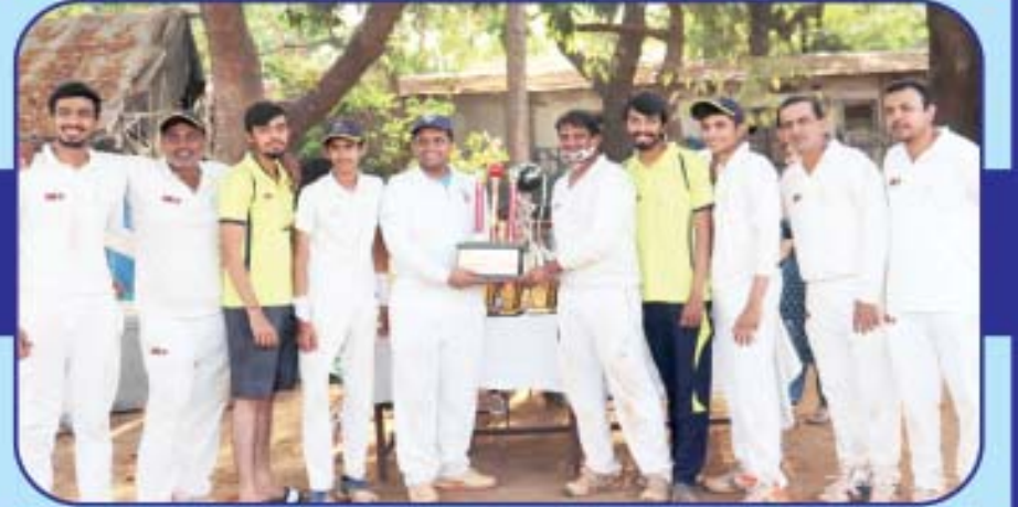
Emerging Cup Runners Up - Young Mens CC - A

જેલદિલીથી છલોછલ ..... રમતવીરો સો સો સલામ...કોરોના મહામારીમાં પણ જે ઉત્સાહ જતાવ્યો છે તે ખરેખર કાબિલેદાદ છે.